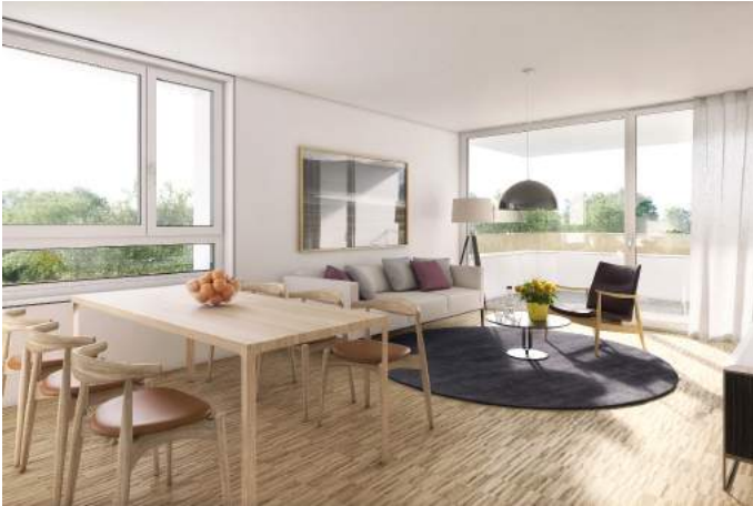
QUARTIER ILLUFRER WOHNZIMMER