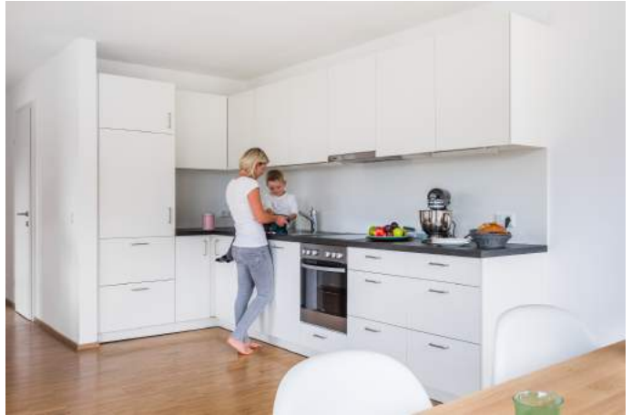
QUARTIER ILLUFRER KÜCHE